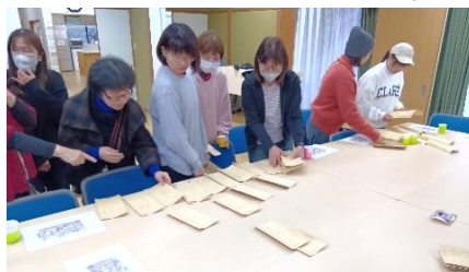
未来の自分への手紙を仕分け