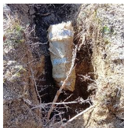
掘り出したカプセル