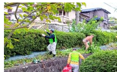
やくだち隊プロ？剪定士達

6月に剪定をし、綺麗になったふれあいセンター周辺の斜面の植込みも4ヶ月を過ぎて、また元に戻り、根っ子付近で切り落とした桑の木も我が物顔で幅をきかせていました。10月11日にやくだち隊で2回目の剪定を実施。これで来春まで綺麗に保てる事と思います。同時に行っていた1丁目空地2区画の除草は来期からやくだち隊の作業から外す予定です。