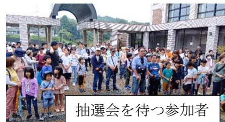
抽選会を待つ参加者

10月5日帷子スポーツの日のウォーキングに愛岐ケ丘は5丁目公園から帷子地区センターを目指すコースで24名が参加しました。各地区からの参加者計230名が到着後、抽選会で盛り上がりしました。