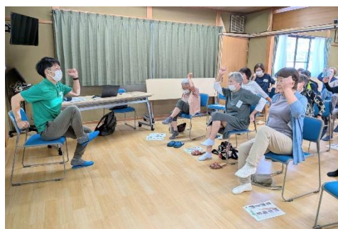
お馴染みの元気はつらつ講座 「みんなで笑顔の若返りチェック!!」