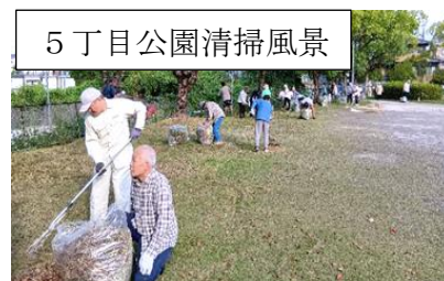
5丁目公園清掃風景

9月28日に今年後半最初の一斉清掃に多数の皆さまに参加していただき、団地中が綺麗になりました。機械を使った事前除草場所が増え、当日の作業負担が軽減された所も多くなってきたのではないのでしょうか。