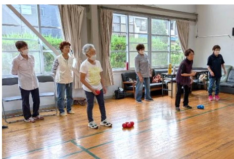
今日も歳を忘れて楽しく ボッチャを楽しめました 😊