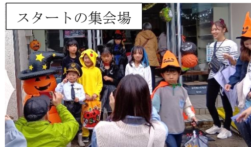
スタートの集会場