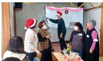
クリスマス会 童心に帰ってゴロゴロドッカンボール遊びやビンゴゲームで盛り上がりました