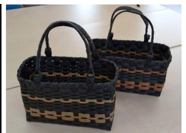
クラフトテープバッグ 第2弾