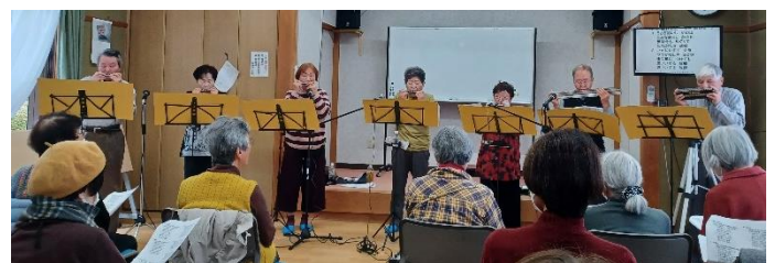
大小様々なハーモニカ8台で美しいハーモニーを奏でて下さいました