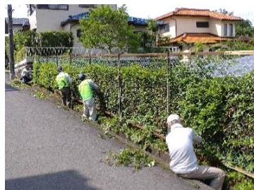
ネット際はコツコツ作業