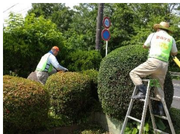
職人技で造形作業中