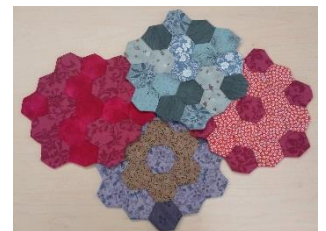
作品：へキサゴンの鍋敷き (端布で簡単制作)