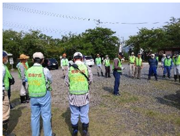
揃いのベストでいざ出陣