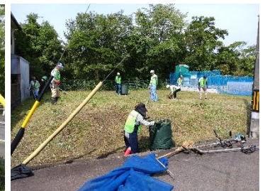
1丁目空地除草作業