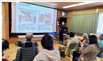
中北薬品「自律神経を整える」講座のハンドマッサージ