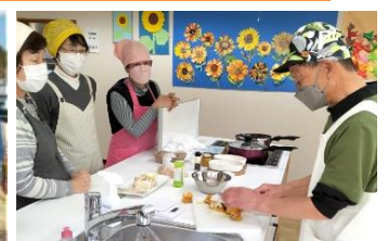
「カボチャのグラタン健康レシピで調理」