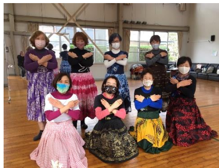
ナニマカマカ（フラダンス） 美女の妖艶な舞にウツトリ！

皆様の投稿をお待ちしています。 投稿は自治会メール aigi5212@wh.commufa.jp