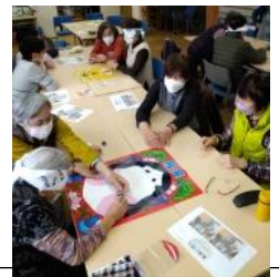
懐かしいお正月遊び