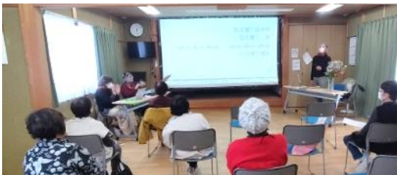
「笑顔で歌おう!!」番外編 1月10日（火）集いの会で歌います。