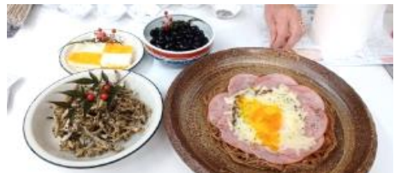
12月9日旬のおかずレシピ交換会・・・蕎麦のガレット・おせち（田作り、黒豆、二色卵）