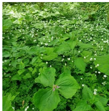
ニリンソウとサンカヨウの花盛