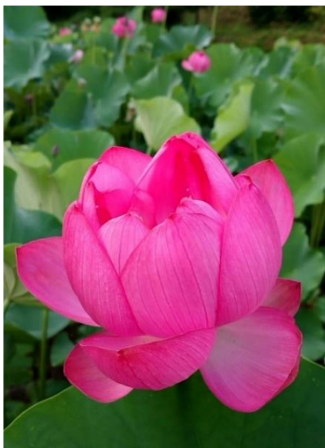
今年も薬王寺の蓮が可憐な花を咲かせました。7月初旬