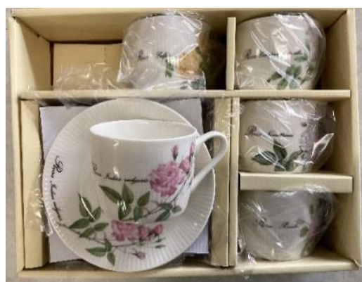
コーヒーカップセット 残りわずか (無料)