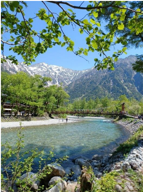
河童橋と穂高連峰