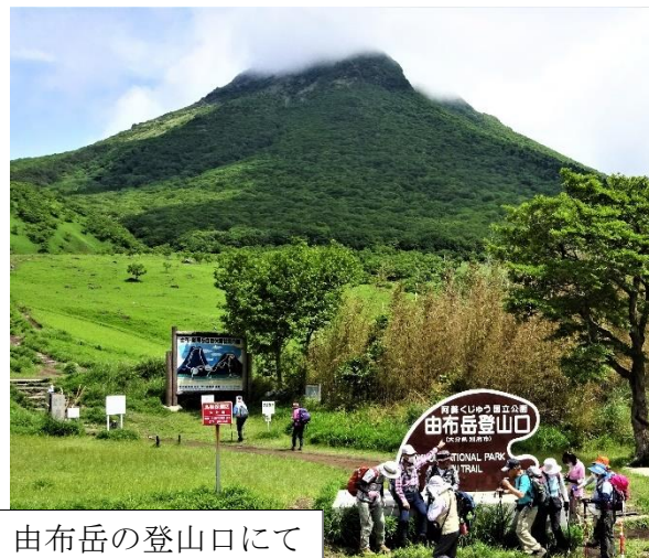
由布岳の登山口にて

6月の初めに仲間10人と一週間九州の山旅を楽しみました。期待していたミヤマキリシマは終りがけで残念でした。これからもコロナ対応しながら元気に生活していきたいと思えます。