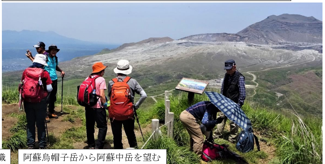
阿蘇烏帽子岳から阿蘇中岳を望む