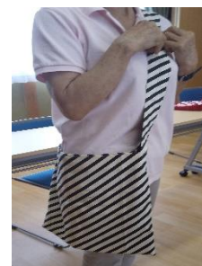
最新ハンドメイド作品