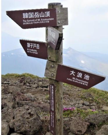
霧島山（韓国岳）山頂付近標識