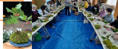
12月7日苔玉教室(30名参加)

2022年が平和で明るい年になりますように。今年も人の和を大切に、笑い声と笑顔のあふれる場になれますように頑張ります。1月11日からまた皆さまの笑顔にお会いできるのを楽しみにお待ちしております。