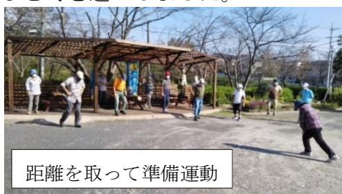
距離を取って準備運動

緊急事態宣言から解放され、快晴の青空の10月4日友和会の有志14名で春里→長洞(禅林寺)→光陽台のコースで今年度4回目のウォーキングを楽しみました。途中、長洞の集落でミョウガを採取するというハプニング(もちろん所有者の了解を得ています)もあり、汗をかきながら約1時間半楽しいひと時を過ごしました。