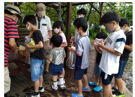
参加賞を受け取る子どもたち