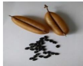
〈花の名〉 コガネタヌキマメ (黄金狸豆) 別名 ベビーマラカス、幸せの鈴