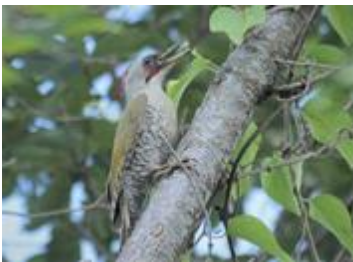
アオゲラ (メス) 鳩ぐらいの大きさ