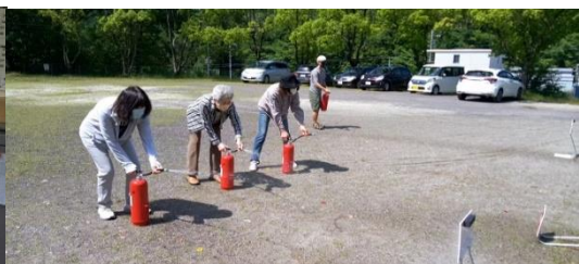
模擬消火器で消火訓練