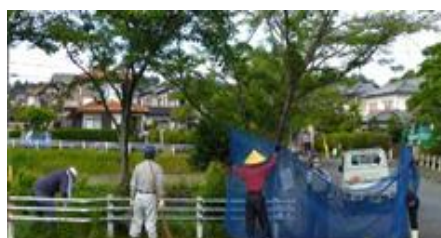
調整池の清掃活動(6月5日)

ボランティアの皆様お疲れ様です。 今後の日程は7月(2日)空地の草刈、 ふれあい広場剪定、4丁目公園草刈 (5日)2丁目公園草刈り(7日)1・ 5丁目公園草刈り(10日)ロードサポ ート市道草刈り、など炎天下での作業 が目白押しです。熱中症には十分気を 付け、元気に乗り切りましょう。