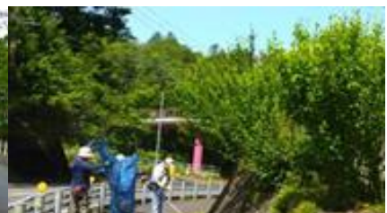
歩道橋周りの清掃活動(6月12日)