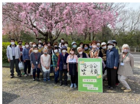
三月三十日（火曜日） 「静かに桜を見る会」 満開の桜と満面の笑顔