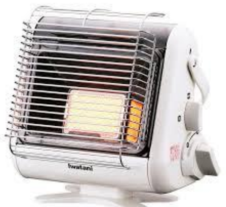
カセットガスストーブの一例

いつ襲われるか分からない自然の災いも、いつ終息するか分からないコロナ禍も、各自・各家庭でしっかり対策して、最小限の被害に食い止めていきたいと思います。