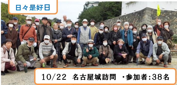
10/22 名古屋城訪問 ・参加者:38名

未だ青モミジで覆われている龍門瀑や大曾根の瀧などが迎えてくれた徳川園や、本丸御殿内部の絢爛豪華を誇る障壁画・飾金具!! 今回のバス旅行企画が、日頃のコロナ喧騒から離れて、家にこもるリスクから、さらにはメンタルヘルス向上に役立ててもらえたのではないかと考えた次第で御座います。