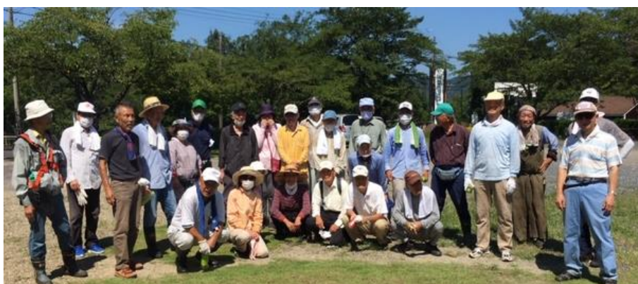
ロードサポートの実施予定日の土曜の度に雨降り・・・☹️ 4度目の正直、折しも梅雨明けとなった8月1日、満を持して(!?)照りつける太陽をものともせず、30名ほどで1時間半の除草や清掃作業。「きれいになったわ!うちの団地はよそとは違うよ!」汚れて汗をかいて、終了後集合写真。たいへんお疲れさまでした。