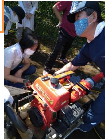
防災防犯委員会では、2ヶ月に一度、可搬ポンプの点検と試運転をします。8月1日も、防災倉庫の救急箱の点検と併せて実施しました。