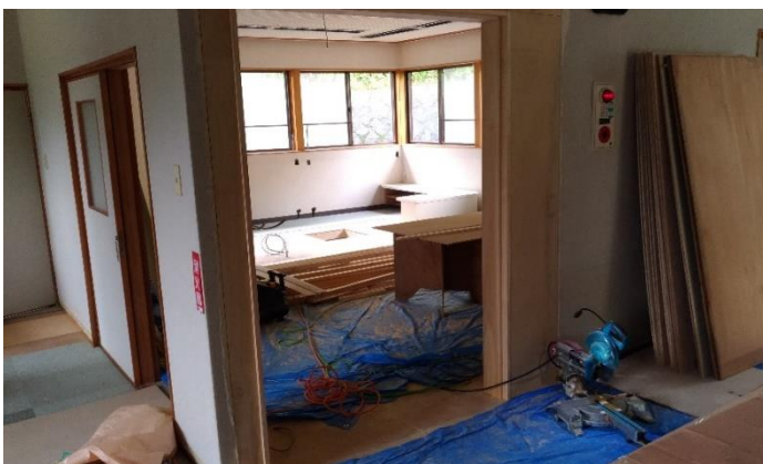
(サロン室に新しい入口で動線改善)

コロナ禍のなか改修工事の遅れが心配されましたが、今のところ順調に進んでおり、予定通り7月11日の開館を目指しております。ふれあいセンターオープンまでしばらくお待ちください。