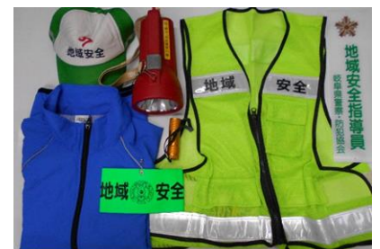
地域安全指導員の引継ぎグッズ